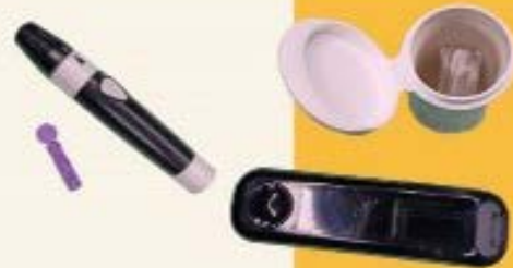
Lancetero, lancetas, glucómetro y tiras reactivas